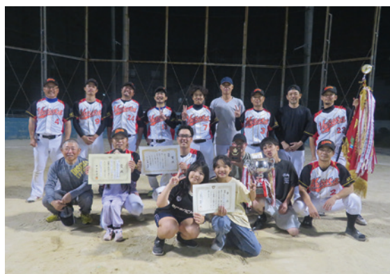
優勝した株式会社豊衛生舎チームの皆様

優勝 株式会社豊衛生舎 準優勝 株式会社近藤組 第3位 株式会社豊電子工業 敢闘賞 株式会社東陽