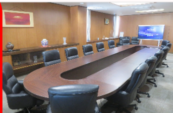
保護中: 特別会議室