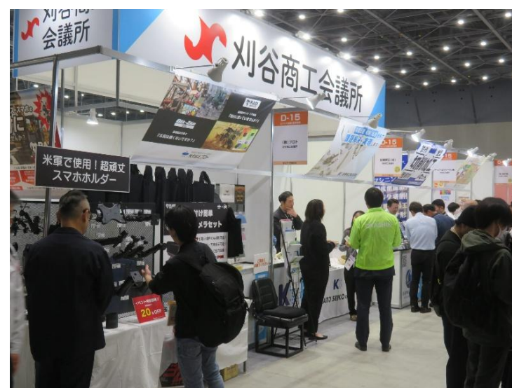
出展ブースイメージ