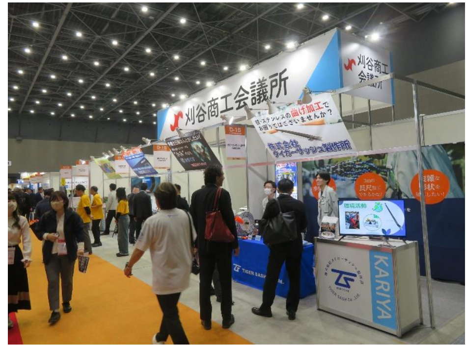
昨年度の共同出展の様子