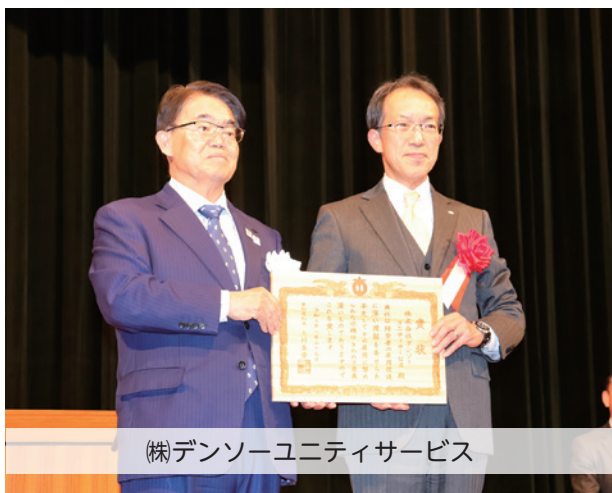
(株)デンソーユニティサービス

この表彰は、愛知県が、障害者雇用に深い理解を示し、率先して障害者雇用に努めている企業等を障害者雇用優良企業として表彰し、障害者の雇用促進と職場定着を推進するため、1968年から実施されています。