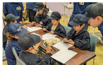
Out of KidZania in かりや 2024の様子