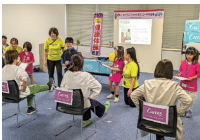
Out of KidZania in かりや 2024の様子