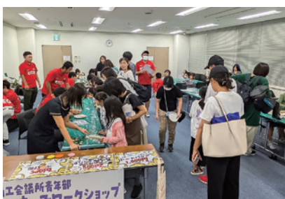
青年部ワークショップ