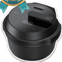
Panasonic自動調理鍋 オートクッカー ビストロ