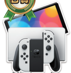
Nintendo Switch (有機ELモデル) ホワイト