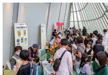
1 Table マルシェの様子