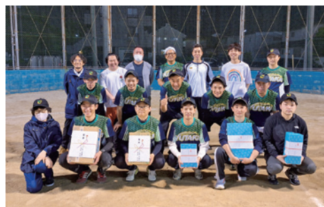
優勝した株式会社豊電子工業チームの皆様