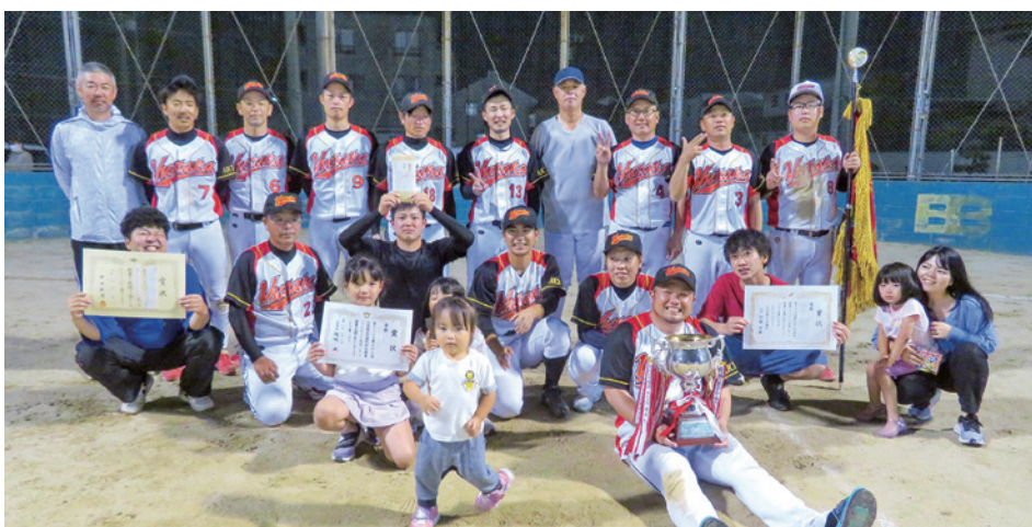
優勝した 株式会社豊衛生舎 チームの皆様