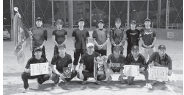
今大会で優勝した 株豊電子工業チームの皆様

6月4日より4日間にわたり第59回刈谷商工会議所部会親善ソフトボール大会が、各大会の代表12チームが参加し、双葉グラウンドにて開催されました。成績は以下の通りです。