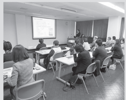
20名の方々にご参加を頂きました