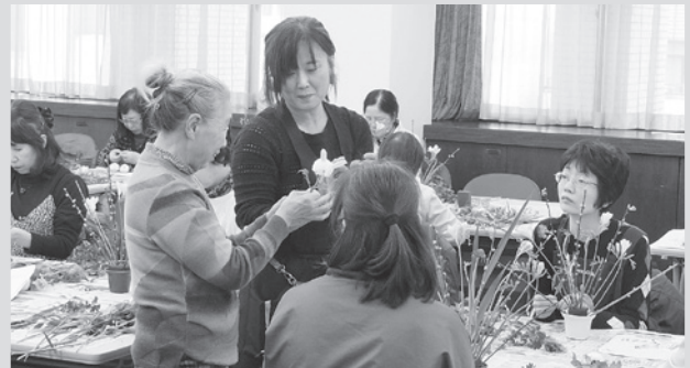
3日間で延べ93名の方々にご参加を頂きました