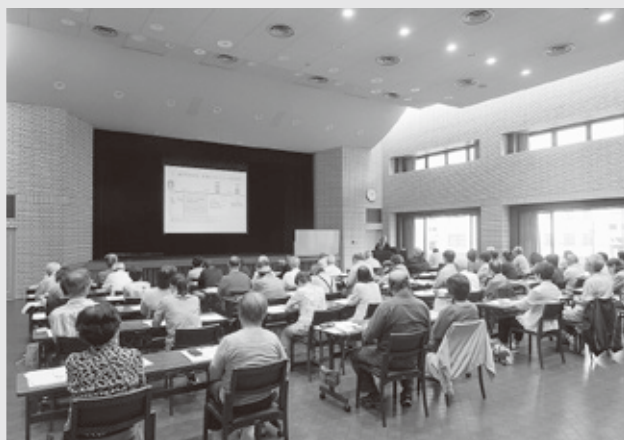
当日は58名の方々にご参加を頂き、大好評でした！