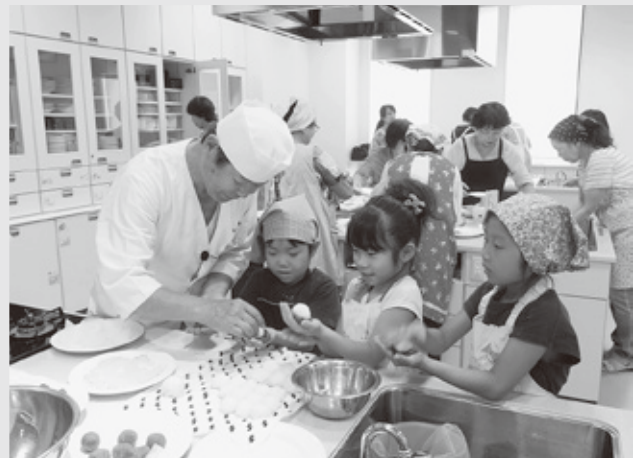
当日は80名の方々にご参加を頂きました。