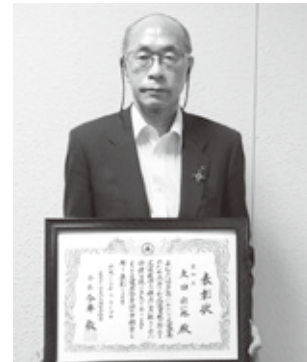
【受賞された太田会頭】

当商工会議所では、引き続き、会員企業・警察行政と連携して安心安全な街づくりと地域経済の活性化に資する活動を継続して参ります。