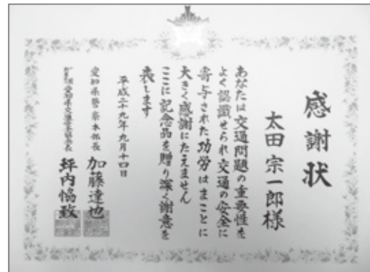
【愛知県警察本部長・愛知県交通安全協会会長感謝状】