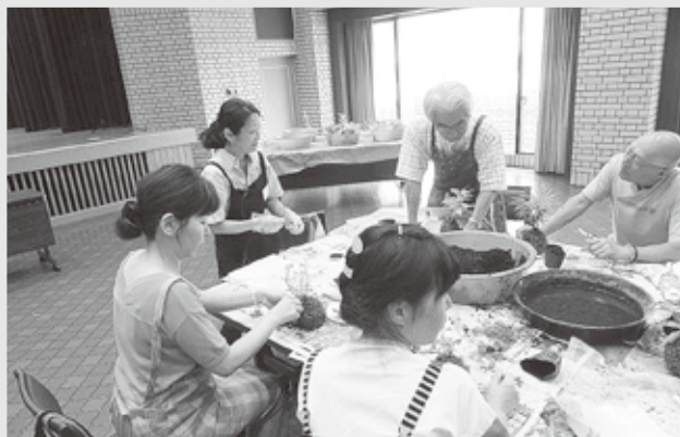
当日は40名の方々にご参加を頂きました

おもてなしに——。 友との語らいに——。 ご家族揃ってのお食事に——。 贅を凝らした「だる磨」の味をお楽しみください。