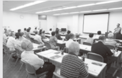
27名お集まりいただきました