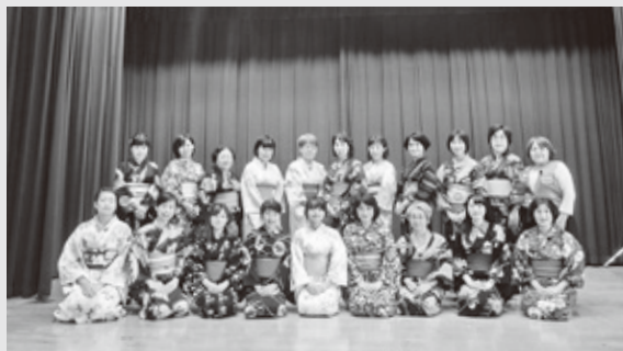
当日は20名の方々にご参加頂きました

参加者からは、「男性用の浴衣の着付け、帯結びの仕方を覚える事ができてとても良かったです。久しぶりに夫婦で浴衣デートしたいと思います。」「いろんな帯結びのアレンジの方法を教えてください、とても楽しかったです。帯結びにルールはないという言葉が印象的でした。」「今までは一人で着付けができなかったけど、今回1人でできる着付けの方法を教えてくださいましたので、とても良かったです。」などの感想を頂き、“終始明るく笑顔の絶えない大好評の講座”となりました。