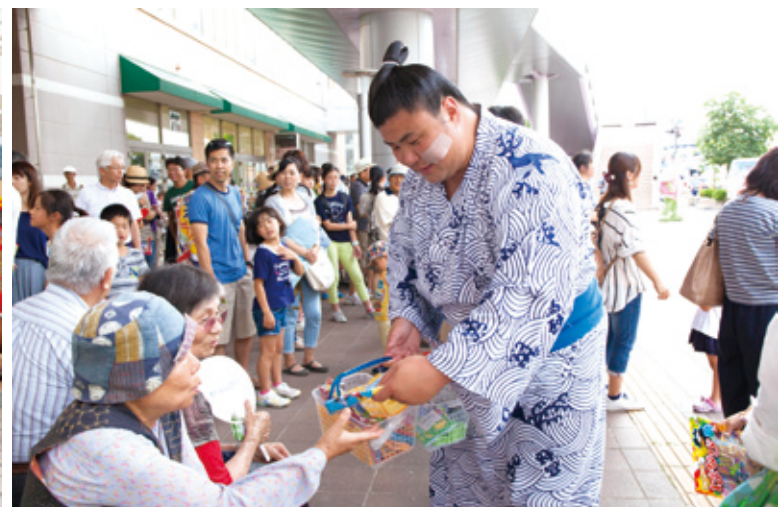
【交通安全・防犯啓発品の配布】

刈谷商工会議所・刈谷警察署は、7月1日(土)、刈谷駅南口「みなくる広場」におきまして、『交通安全』及び『侵入盗・振り込め詐欺根絶』総決起大会を開催致しました。詳しくは2ページをご覧ください。