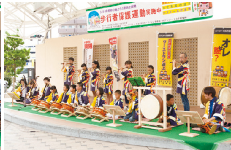
【小垣江山車保存会による演奏】