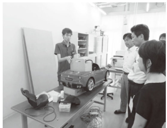
実習内容を説明する専攻科の生徒

今後も、当所会員企業と愛知総合工科高等学校と各種事業を通じて、連携を図ってまいります。