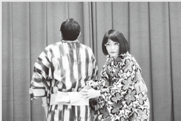
今回は「男性用の浴衣の着付け」も教えて頂きました