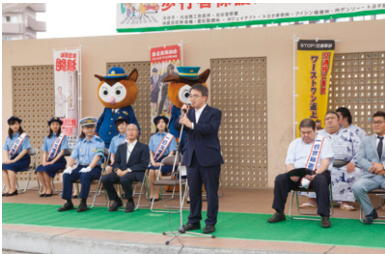
【大村秀章愛知県知事によるご挨拶】