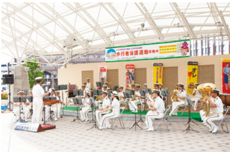
【愛知県警察音楽隊による演奏】