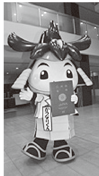
市役所で申請するカーリー！