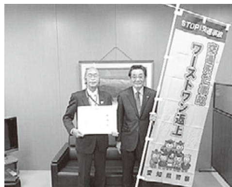
【愛知県警察交通部長から感謝状】

また、企業のCSR/CSV（本業を通じた社会貢献）に企画の段階から参画することで、警察とマッチングやマスコミへの効果的な広報支援も行うことで、企業の認知度・信頼性の向上にも寄与しました。