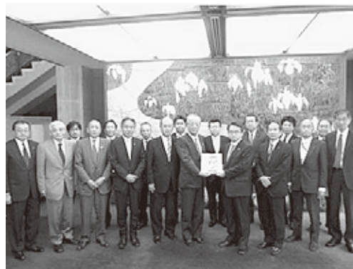
【愛知県知事への要望会】

西三河と知多地域の地域高規格道路「国道23号」、「西知多道路」を結ぶことで、物流の効率化など産業、経済活動の更なる発展に繋げるため、西三河知多アクセス道路の実現に向けた要望書を国・県へ提出致しました。