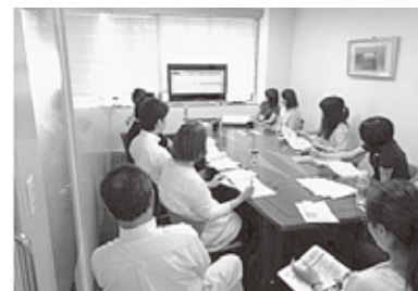
【刈谷モノづくり大学】

今年度は、商業・サービス業向けに、消費者の心をつかむマーケティングの実践方法や新たなビジネスモデルの挑戦による経験談などをテーマにしました。