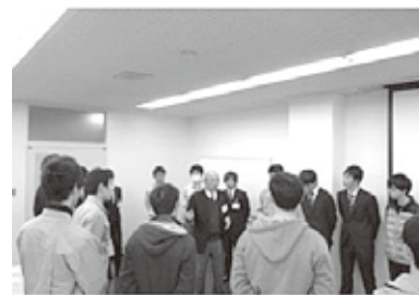
【刈谷モノづくり大学院】