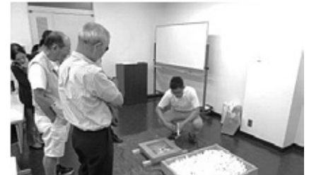
【かりや商人大学大学院】