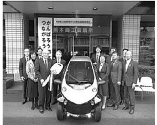
【熊本商工会議所へ電気自動車寄贈】

東北復興支援では、宮城県の地域産業資源である「ずんだ」を活用した新商品開発を開始し、わずか1年の間に、1tを超える「ずんだ餡」を東北より仕入れ、その餡子を使った新商品が刈谷で消費されており、東北支援と地域経済活性化を両立した事業を行いました。