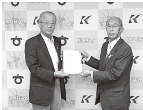
【刈谷市へ要望書提出】

中小企業・小規模事業者が、不安定な情勢でも持続的に成長していくために、経営体質強化を目的とした設備の更新、人材の確保、商品開発、販売促進など、多様化する企業の経営課題を解決するための新たな補助金の創設や深刻な人手不足の中、貴重な人材に資格取得や専門知識を学んで頂くビジネススクール事業の補助金を刈谷市へ要望致しました。