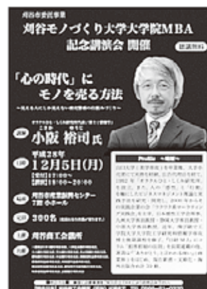
【刈谷モノづくり大学大学院MBA】