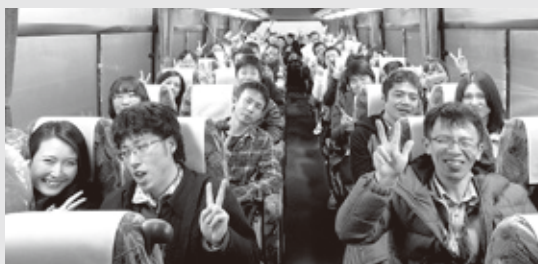
【楽しい会話で盛り上がる車内風景】

一日中雨天で気温も低く寒い日となりましたが、参加者からは「商工会議所・婦人会主催の婚活事業なので安心して参加できた」「スタッフの配慮がうれしく、様々な人と知り合いになることができた」など、参加者からは高い評価をいただきました。