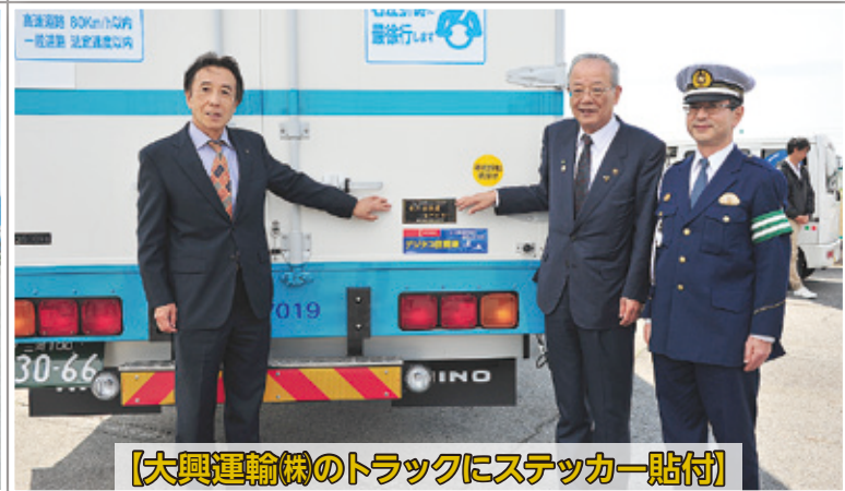
【大興運輸(株)のトラックにステッカー貼付】

平成29年4月27日(木)に、交通事故根絶に協力する事業所105社の内、代表事業所33社(約100名)に集まって頂き、トヨタ車発祥の地から交通事故を根絶していく意識を高めて頂く場として、決起集会を開催致しました。