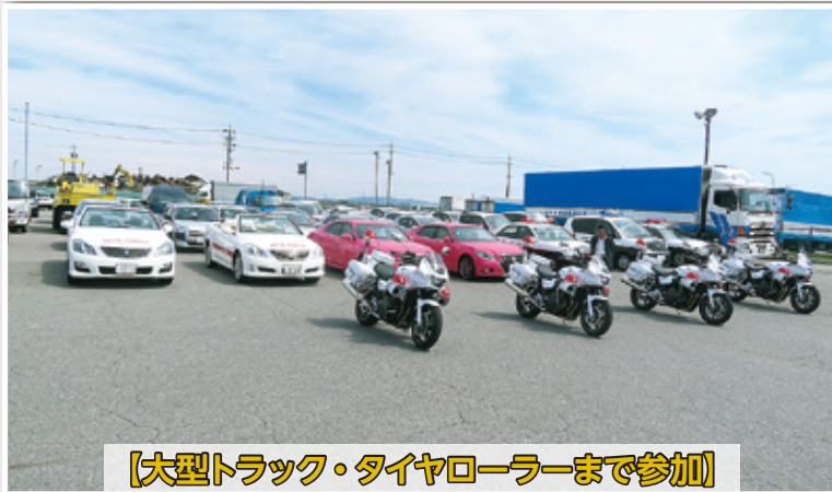
【大型トラック・タイヤローラーまで参加】