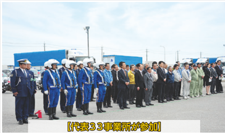
【代表33事業所が参加】