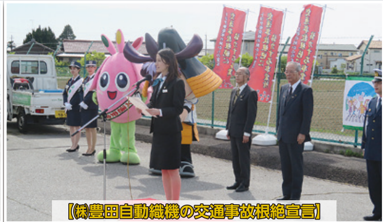
【(株)豊田自動織機の交通事故根絶宣言】