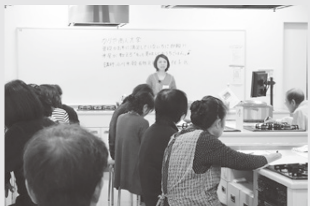
当日は28名の方々にご参加を頂きました

おもてなしに——。 友との語らいに——。 ご家族揃ってのお食事に——。 贅を凝らした「だる磨」の味をお楽しみください。