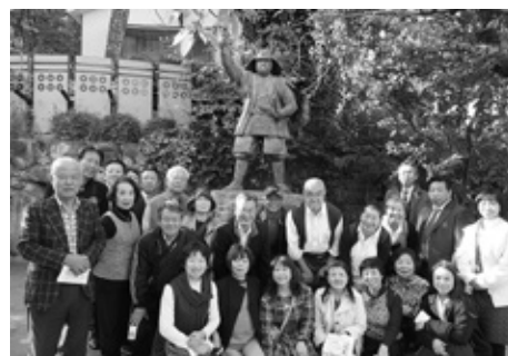
玉造・三光神社にて集合撮影

今回の視察を通して、地域全体で一体感の創造をするには、地域社会全体の理解と協力が必要であることを痛感した研修会となった。