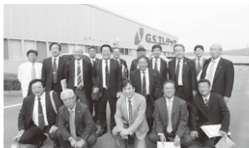
(株)ジーエスエレクトリック九州にて集合写真

また、平成27年7月5日世界文化遺産として正式登録された「軍艦島」や五島産の芋・麦・米を原材料に、五島の名水である七岳山系の湧水で作る「五島列島の酒蔵・株式会社五島列島酒造」などを視察することにより、様々な角度から観光資源や地域資源を活用し、地域経済活性化を推進している現状を視察し、この刈谷地域の経済活性化策のヒントとすることが数多くあり、この3日間の視察を通して、日々の業務の改善の大切さを改めて認識し、働く人の喜びが会社の業績に大きく影響を与えることを学び、観光資源の活用により観光客が喜ぶ仕組みづくりの実践を現地・現物・現実で視察し、考察できる大変有意義な研修視察となりました。