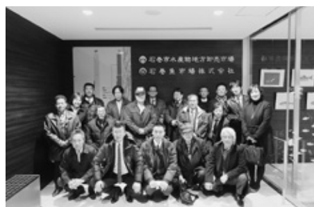
石巻魚市場株にて集合写真

この研修視察を通して、「仙台・石巻」の現状を目の当たりにすることができ、今後起こりうる東南海地震に備えるための企業としての防災対策や行政の取組、また刈谷商工会議所として取組まなければならない役割の重要性を再認識できた大変有意義な研修となりました。