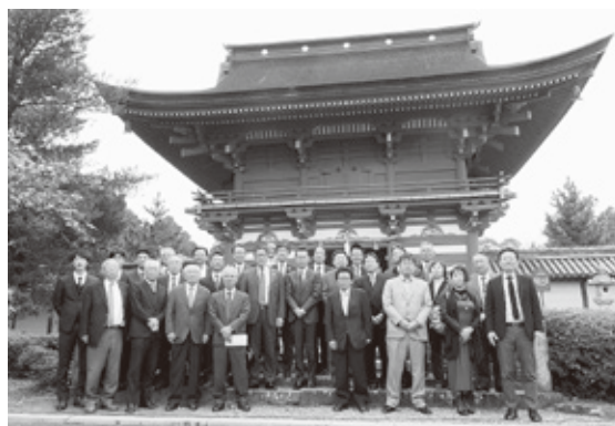
南宮大社にて集合写真

今回の研修では、ビンを再生する際に、非効率的な手作業による分別の必要を知り、3R(リデュース、リユース、リサイクル)など、今後の地球環境を守るために必要な循環型社会を推進することの大切さと、ビンの利用者としてのマナー（異物を混入させない・綺麗に洗う等）の大切さを、現地・現物・現実で視察することができ、大変有意義な研修視察となりました。