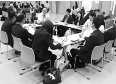
テーブル懇談での質疑応答

また、情報交換会では、各担当者から、大学ごとの違いを踏まえて、「今年変更された採用活動時期の前倒しによる現状課題と対策のしかた」「最近の理工系学生に自社を訴える上での有効的な方策やポイント」「学生は就職相談の際、企業にどのような条件を求め、どう指導されているか」など、多岐にわたる内容を質問されるなど、多くの人脈が生まれ盛会のうちに終えました。