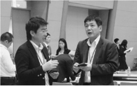
大学教職員との名刺交換会

今年で13回目を迎えたこの情報交換会は、技術的専門分野を専攻課程とする理工系の人材確保やインターンシップなどの共同研究など、人財確保と産学連携をねらいに毎年開催されており、中部地方の国・公・私立の参加大学18校（愛知工業大学、愛知産業大学、金沢工業大学、滋賀県立大学、静岡大学、静岡文化芸術大学、静岡理工科大学、信州大学、大同大学、中京大学、中部大学、豊田工業高等専門学校、豊橋技術科学大学、名古屋工業大学、名古屋大学、南山大学、福井工業大学、名城大学）から24名の大学教授や就職担当者が出席され、西三河地区の企業からは、98社128名のご参加を頂きました。