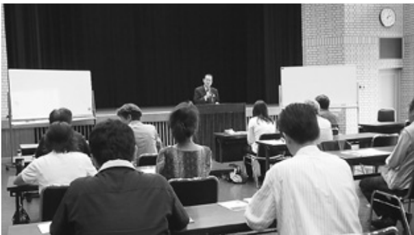
専門家からの考察を加え、市場環境や顧客ニーズを読み、提供すべき逸品を考える

今後は、顧客から支持され続ける「魅力的な商品（サービス）の開発」を継続し、さらに、訴求力のあるセールスプロモーションの方策についても学び検討して参りますので、今年度の『逸品』にご期待ください。