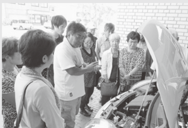
当日は18名の方々にご参加頂きました