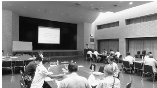
研究会において、商品・サービスの魅力を引きだし、より効果的に伝えるための方策を学び検討する