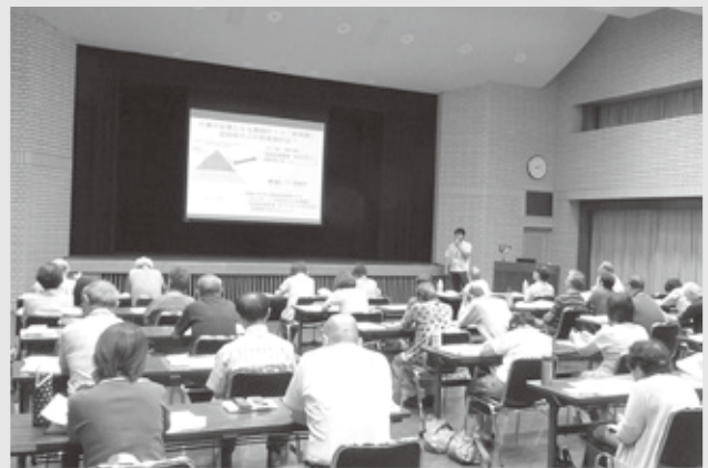
当日は35名のご参加を頂きました