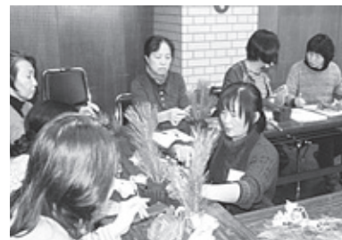
【かりや商人大学大学院】