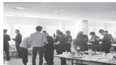
【ブレックファストミーティング】

第1部では、ブレックファストミーティングとして愛知県内の高校および特別支援学校18校34名の先生と参加企業23社33名の情報交換・名刺交換会を実施し、第2部では、企業説明会、ハローワークによる就職相談、職業適性診断を行い生徒89名保護者35名に参加頂きました。