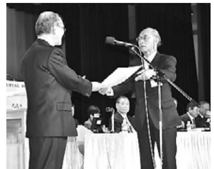
【日商三村会頭より表彰状を受け取る】