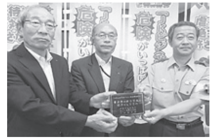
【青少年健全育成に協力する事業所始め式】

また、企業のCSR/CSV（本業を通じた社会貢献）に企画の段階から参画することで、警察や社会福祉協議会とマッチングマスコミへの効果的な広報支援も行うことで、企業の認知度・信頼性の向上にも寄与しました。