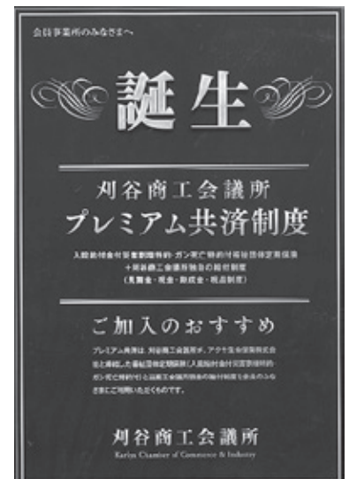
【プレミアム共済制度パンフレット】

企業が求める福利厚生制度が時代とともに変化していく中で、更に会員事業所のお役に立て、親しんで頂ける共済制度へ生まれ変わり、名称も「アイリス共済」から「プレミアム共済」へ改めました。具体的には、これまでの福利厚生制度としての特徴に加えて、掛金・保障内容を変更せずに、共済加入者が協力店で加入者カードを提示すると限定特典が受けられる加入者特典を盛り込み、更に会員事業所・加入者にとって魅力のある共済制度となりました。