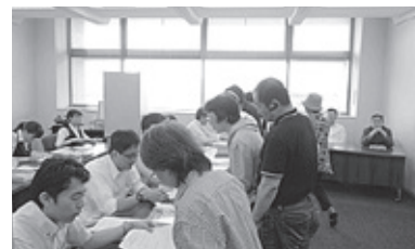
【刈谷市役所での当選者交換】

おもてなしに——。 友との語らいに——。 ご家族揃ってのお食事に——。 贅を凝らした「だる磨」の味をお楽しみください。