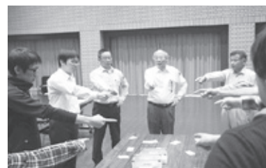
【刈谷モノづくり大学大学院MBA】