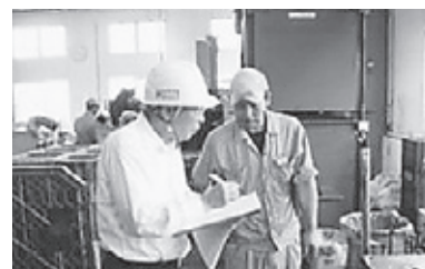
【刈谷モノづくり大学】

さらに、平成27年度からは、企業を取り巻く経営環境が目まぐるしく変化する中で必要とされる「人材育成」に焦点を充てた『刈谷モノづくり大学大学院MBA』を開始し、主に少人数の対象者向け安全教育をテーマとして、研修会を9回開催し延べ213名に活用頂きました。