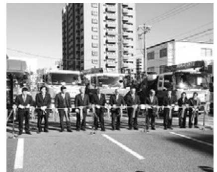
【遊休機械第15回出発式】

また、メイドイン刈谷である電気自動車コムスを宮城県気仙沼・古川商工会議所へ寄贈し、宮城県内の要望を頂いた5商工会議所で被災企業の支援に役立てられます。