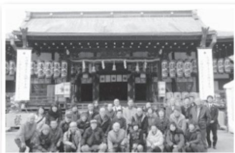
大阪天満宮にて集合撮影

その他にも、なんば地区では、関西発祥の笑いを観劇すると共に、参加者各々が商売繁昌・身体健全・社内安全などを祈願し、新年から縁起の良い初詣・初笑の内容を交えながら、会員事業所と刈谷商工会議所、さらには刈谷の街全体が明るくなるように願いを込めることができ、有意義な視察研修会となりました。