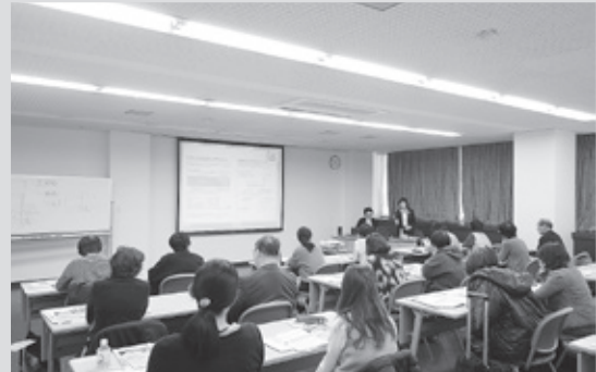
20名の方々にご参加頂きました