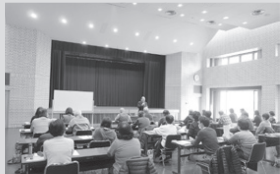
34名の方々にご参加頂きました