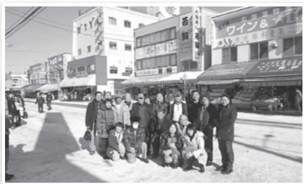
札幌市中央卸売市場・場外市場にて

今回の視察を通じて、毎年期間限定で開催する祭典に多くの観光客の心を引き付ける観光地の「おもてなしの心」と「商いの原点」を現地現物で確認できた大変有意義な研修となりました。