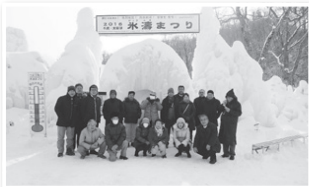
支笏湖氷濤祭りにて