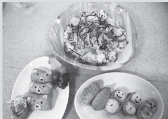
当日に作ったいなり寿司とちらし寿司です