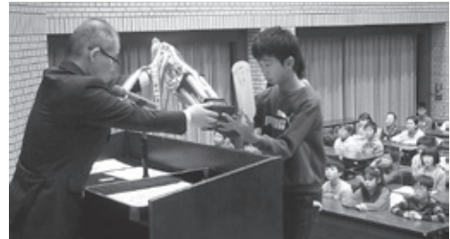
表彰式(団体の部優勝 双葉学園)