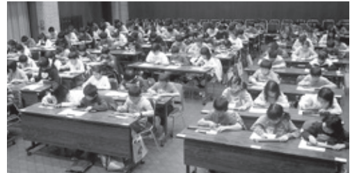
珠算競技中の様子