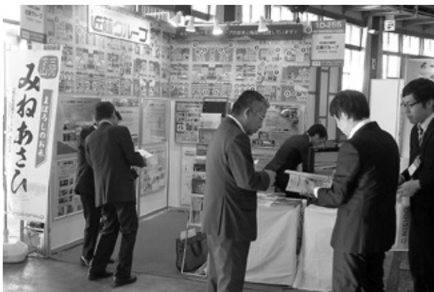
近藤グループ (株)近藤組

2社の出展ブースでは、環境配慮・信頼性・安全性への提案を実現する自社の取り組みを紹介されていました。各社ともに、自社の主要製品の魅力や各事業の特色を、来訪者や見込み客に対し、どう訴えかけるかをブースに集約されており、アイデアを凝らした装飾物や広報ツールを以って、効果的にポイントやメッセージを訴求し、専門性の高い営業マンが来訪者のニーズに合わせた対応をしておられました。