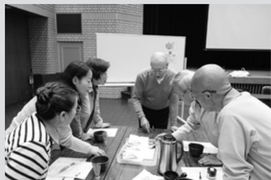
2日間で80名（延べ）のご参加を頂きました