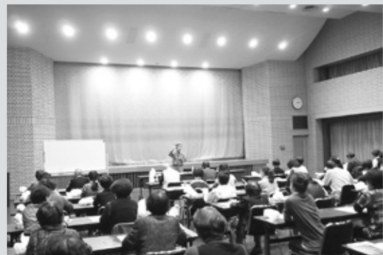
当日は43名のご参加を頂きました。