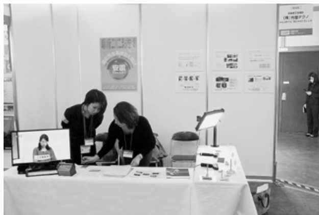
角文グループ (株)光屋テクノ