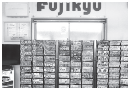
観光事業部取扱パンフレット