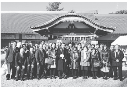
毎年恒例の安全祈願