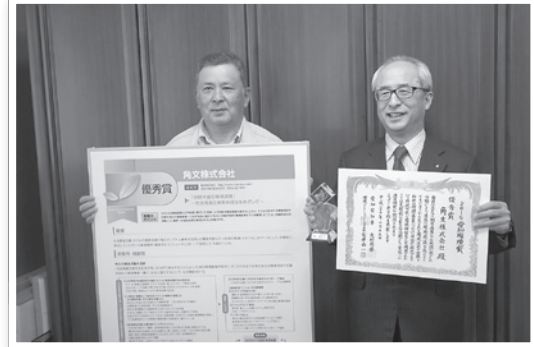
優秀賞を受賞された角文(株)