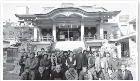
難波神社にて集合撮影

また、難波地区では、関西発祥の笑いを観劇すると共に、参加者各々で商売繁昌・身体社内安全などを祈願し、新年から縁起の良い「初詣」、「初笑」で会員事業所と刈谷商工会議所、さらには刈谷の街全体が明るくなるようにと願いを込める研修視察となりました。