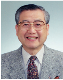
元常議員・ 商業第二部会部会長