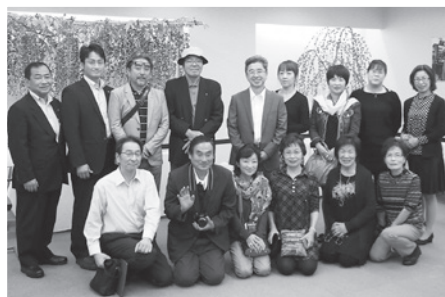
鶴屋吉信本店 地階展示場にて撮影

今回は、商業の集積地で、参加店の逸品発掘のヒントとなる商材や店舗を実際に視察することができ、大変有意義な研修となりました。