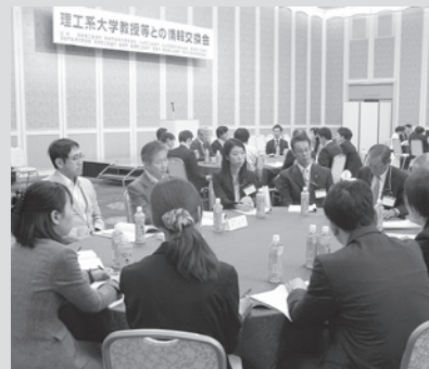
テーブル懇談会の様子

当日は大学・企業担当者の双方から質疑応答による活発な情報や名刺交換が行われ、特に、「最近の理工系学生の希望職種や企業選びのポイント、学科知識以外の面の学校教育の現状、就活時期繰り下げとその対応について、また、企業の求める人材像」など多岐にわたり、非常に関心の高い内容で情報交換が行われ、盛会のうちに終えることができました。