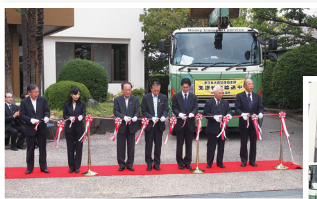
【上・右写真：近藤組本社】