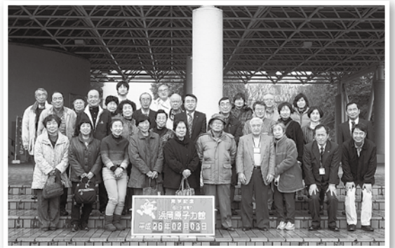
浜岡原子力発電所にて集合撮影

日本において、エネルギー資源の96%を海外からの輸入に頼っている低自給率の情勢を踏まえ、1970年代のオイルショック以降、石油依存からのリスクを分散し、安定供給に向けたエネルギー安全保障の構築と省エネルギー政策が主要課題となっております。そうしたことが、経済を支える企業活動においても非常に重要であると同時に、震災以降においては、原発の安全性向上に向け、設備対策を始めとした各種対策の進行が喫緊の課題となってきています。こうした観点からも、原発については大変関心が高まっており、重大事故に関する新基準を遵守し、建屋内の構造強化の取り組みや、“安全対策には、念には念を入れる”との考えから進められる22メートルもの防波堤の設置など、浜岡原発内において、多くの改造工事や各種対策を目の当たりにすることができ、安全意識の向上について触れるとともに、原発の現状を知る上で、大変有意義な研修を行うことが出来ました。