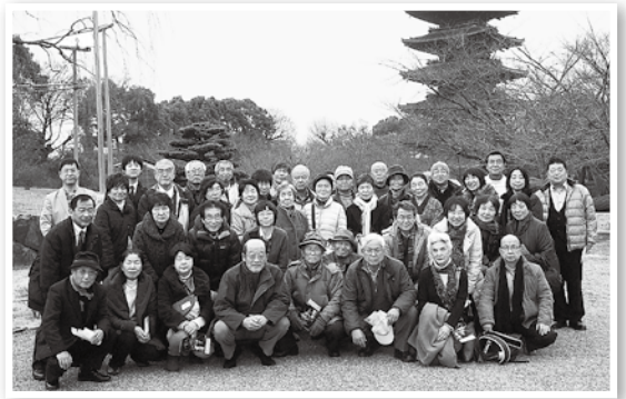
東寺にて集合撮影

そして、今回の視察の見所である、東寺（公称：教王護国寺）は、弘法大師ゆかりの古寺で、その建立は平安遷都の頃まで遡ります。世界文化遺産の一部としても有名ですが、その他にも日本一の高さを誇る木造、五重塔をはじめ、国宝、重要文化財合わせて200点近くを所蔵する歴史豊かな寺院で、真言宗の総本山たる、歴史・学術的にも非常に価値の高いものが数多く、貴重なものに触れるとともに、参加者各々で商売繁昌・身体安全などを祈願しながら、参拝をおこなった。新年から縁起の良い「初詣」、「初笑」で会員事業所と刈谷商工会議所、さらには刈谷の街全体が明るくなるようにと願いを込める研修視察となりました。