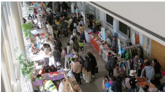
(産業まつり) マルシェ