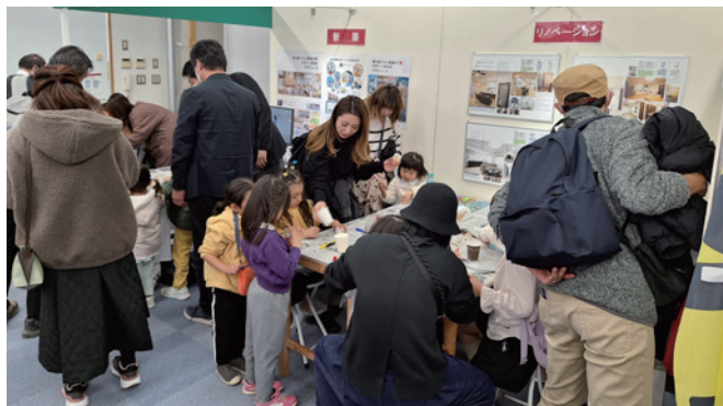
(産業まつり) ワークショップ