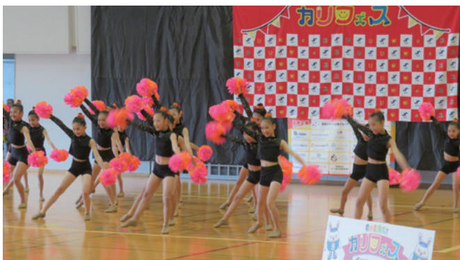
(カリフェス) キッズダンスコンテスト

ご協賛企業をはじめ、関係者の皆様のご協力のおかげで大盛況のうちに開催することができました。誠にありがとうございました。