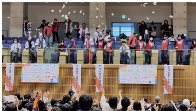
(カリフェス) 大餅投げ大会