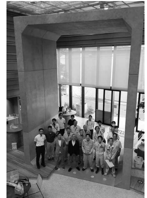
カルバートパークにて