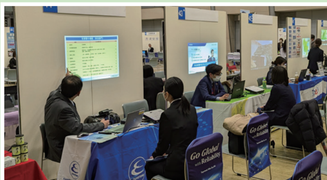
3/12 刈谷・安城・知立・高浜・東浦就職フェア