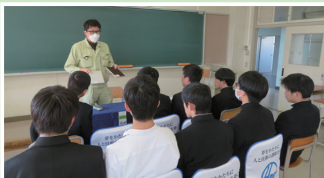
3/15・18 刈谷工科高等学校での企業合同説明会

当所では、引き続き人材マッチングや中小企業の魅力を発信する事業を行ってまいりますので、ご活用ください。