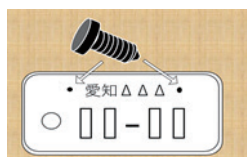
ナンバープレート盗難防止ネジ