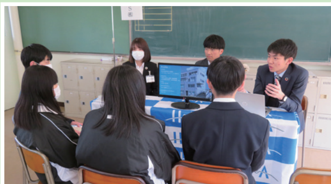
3/7 高浜高等学校での企業合同説明会

会員事業所の採用活動支援として、知立・高浜・刈谷工科高等学校の高校生向けの企業合同説明会、2025年卒業予定の大学生と求職者向けの「刈谷・安城・知立・高浜・東浦就職フェア」を刈谷市産業振興センターあいおいホールにて開催しました。