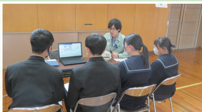
3/4 知立高等学校での企業合同説明会