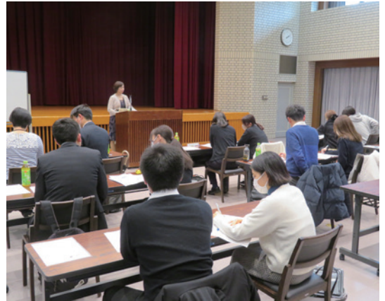
ワークに取り組む参加者

参加者は、途中から講師の質問に積極的に挙手をして答えるなど、前向きな姿勢で参加している方が多くみられ、フレッシュでありながらも高い熱量を感じる研修となりました。若手社員の成長は企業の成長に直結します。受講された方々は、各事業所に戻られてもこの姿勢を継続いただきたいと思います。