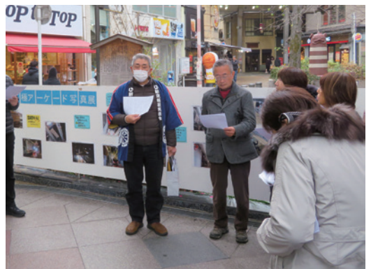
新京極商店街にて