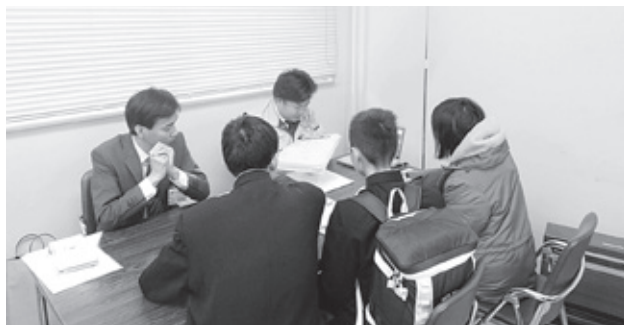
各テーブルの様子