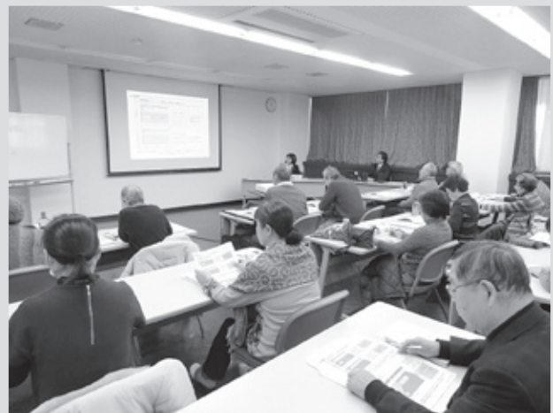
延べ32名にご参加頂きました