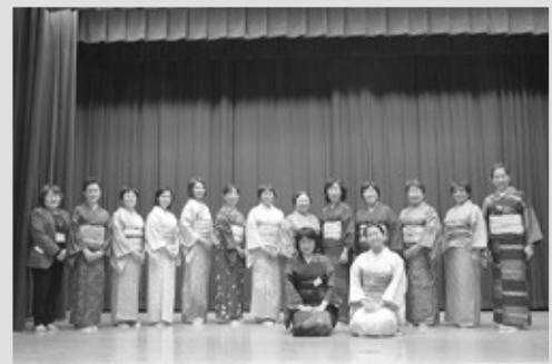
当日は14名の方々にご参加を頂きました！