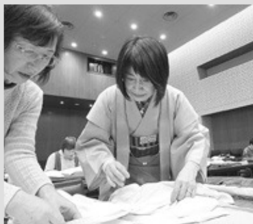
熱心にご指導頂きました！