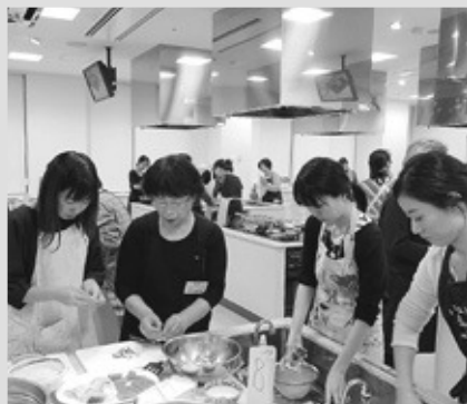
夜間の開講で、働く世代の女性も多く、先生が短時間調理をご指南

「調理中、随所に専門知識を補足頂き、料理への関心が深まる講座でした」「簡単で美味しく見栄えも良く、すぐ家で作りたい」など参加者から大好評の講座となりました。