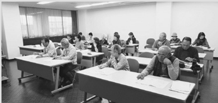
2日間で延べ35名の方々にご参加を頂きました