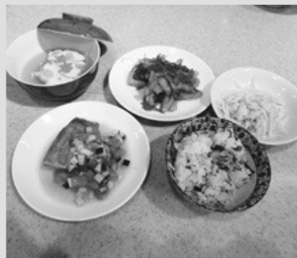
魚と野菜で栄養満点な料理(5品)