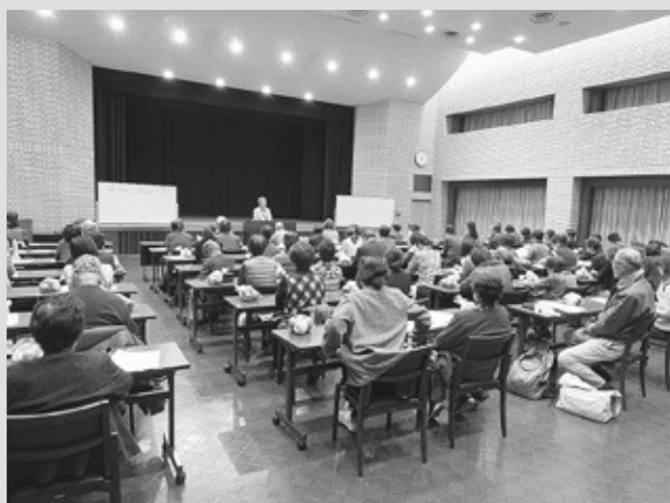
総勢71名の大盛況講座となりました