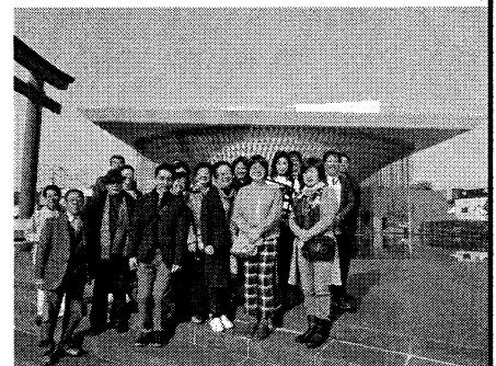
静岡県富士山世界遺産センター の前にて