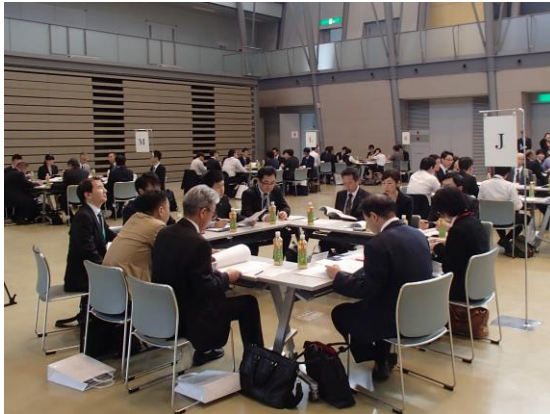
《大学教授を囲んでのテーブル懇談会》